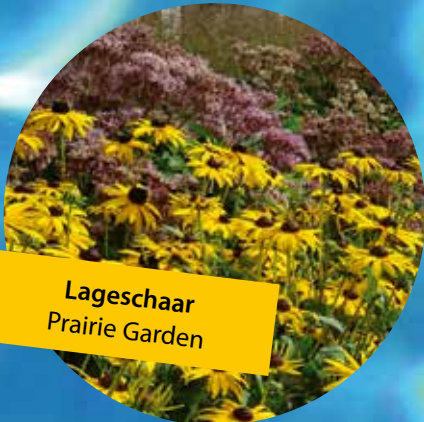
Lageschaar Prairie Garden