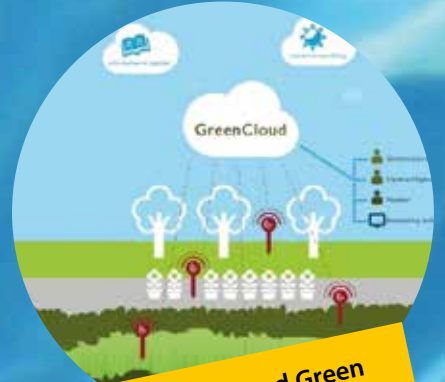
Connected Green De Connected Green app