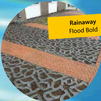
Rainaway Flood Bold