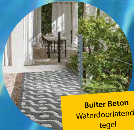
Buiter Beton Waterdoorlatende tegel