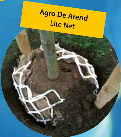
Agro De Arend Lite Net