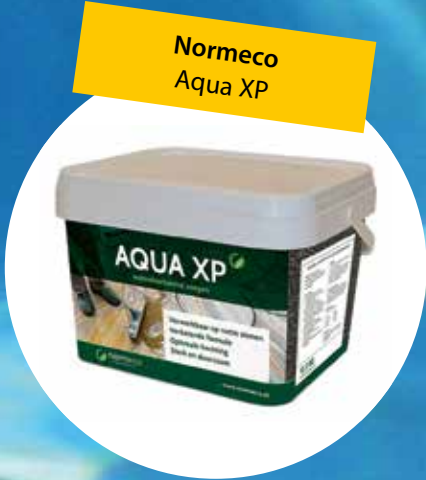
Normeco Aqua XP